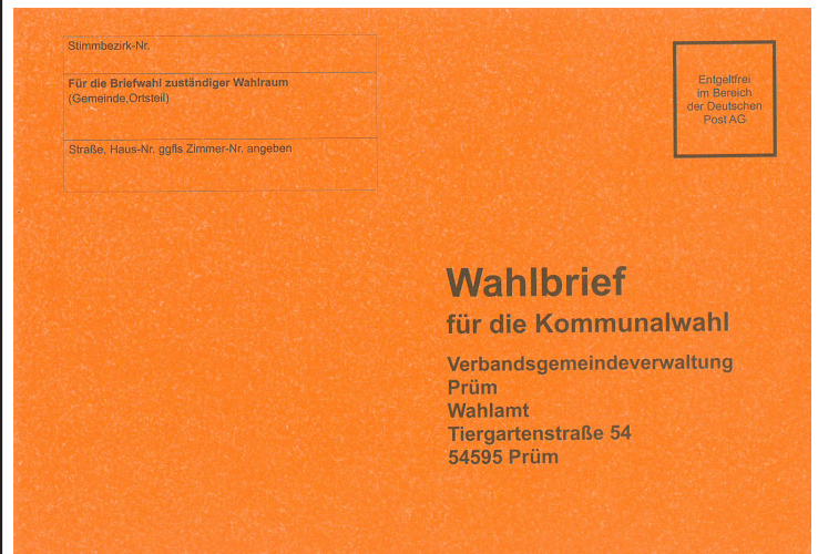
orangefarbener Wahlbrief Direktwahlen

Die Briefwahl für die Direktwahlen ( orangefarbener Wahlbrief ) wird im jeweils angegebenen Urnenwahllokal mit ausgezählt.