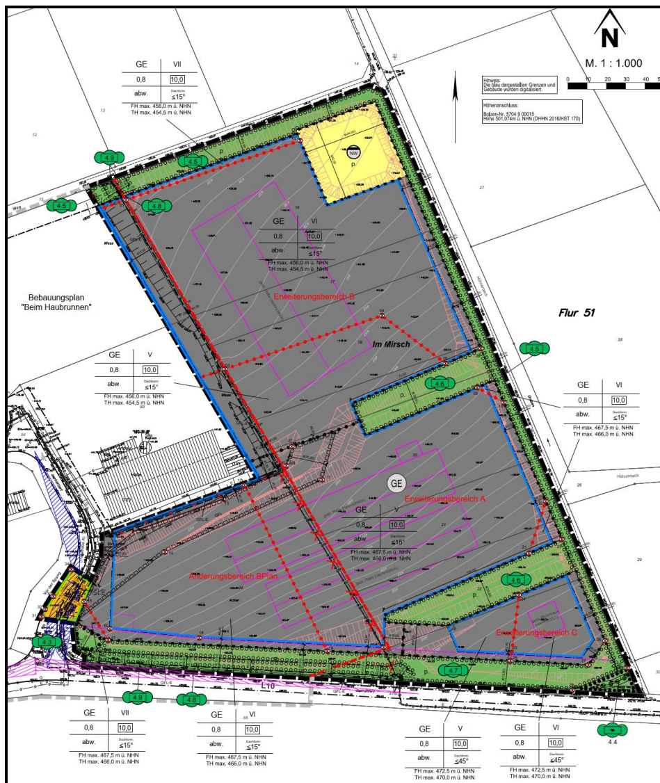
Auszug aus der Planurkunde, unmaßstäblich (----- Geltungsbereich)

Ein ortsansässiger Zimmerei- und Holzbaubetrieb möchte auf der Änderungs- und Erweiterungsfläche des Bebauungsplans seinen Standort für die Produktion von Holzbauelementen ausweiten. Da das Baugelände in Süd-Nord-Richtung ein Gefälle von rd. 30 Höhenmetern aufweist, soll es in drei Ebenen terrassiert werden, um eine Bebauung möglich zu machen. Daraus ergibt sich neben einem Änderungsbereich des ursprünglichen Bebauungsplans ein in drei Ebenen gegliederter Erweiterungsbereich: A (mittig), B (unten) und C (oben, an der L10), siehe nachfolgender Auszug aus der Planurkunde.