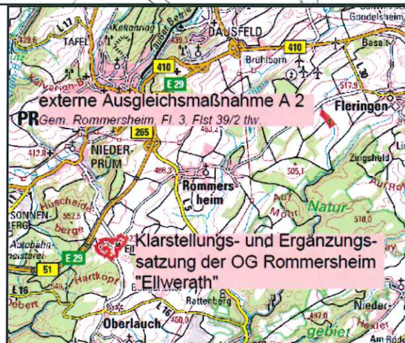
Lage der externen Ausgleichsmaßnahmen